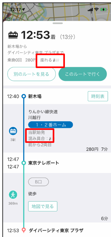
ルート詳細画面 (混雑度表示)