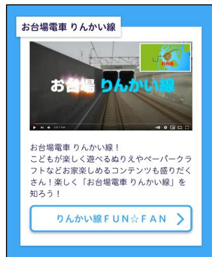
各施設のコンテンツ画面イメージ